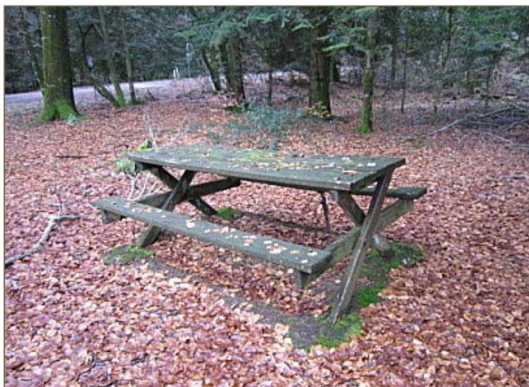
Apparition de mousses sur une table en bois et au niveau du scellement des pieds