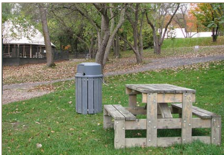
Table en bois : grisonnement