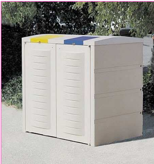
Abri à conteneur (coffre) - PARTHENAY