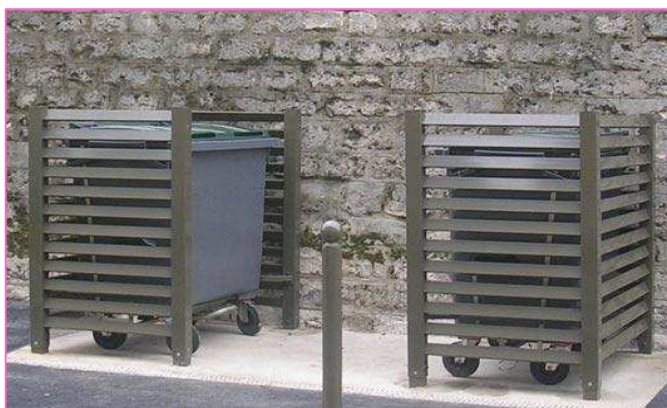
L'implantation de la borne assure l'accès aux poubelles