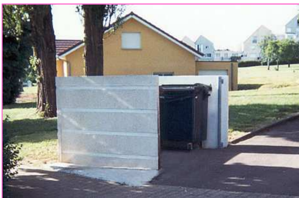
Claustra en béton, implanté sur un revêtement