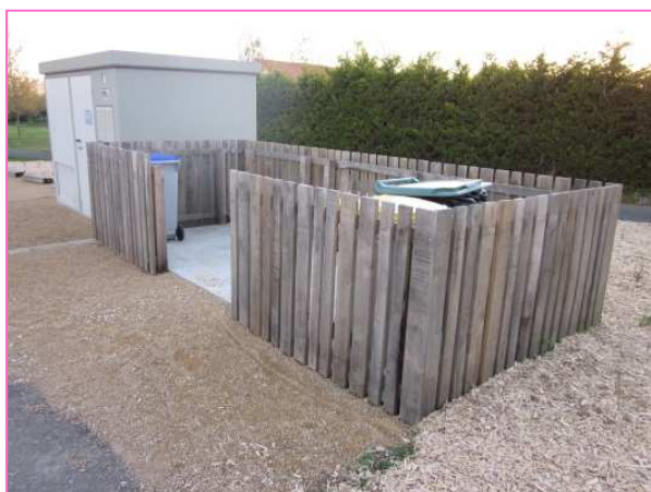
Cache conteneurs avec dalle béton coulé - LUCHE THOUARSAIS

L'implantation sur un accotement, nécessite la confection ou la pose d'une dalle (acier ou béton) pour faciliter l'entretien du local mais également la manœuvre des poubelles.