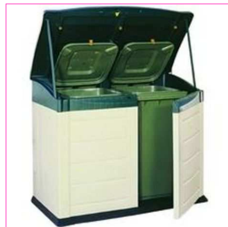
Abri à conteneurs - PARTHENAY