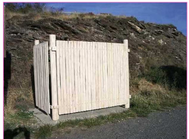
Claustra en bois avec une dalle béton