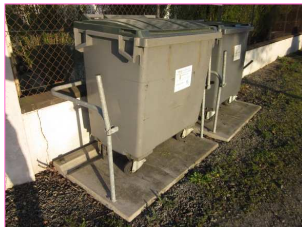
Ensemble complet comprenant une plateforme béton, un arceau métallique - BRESSUIRE