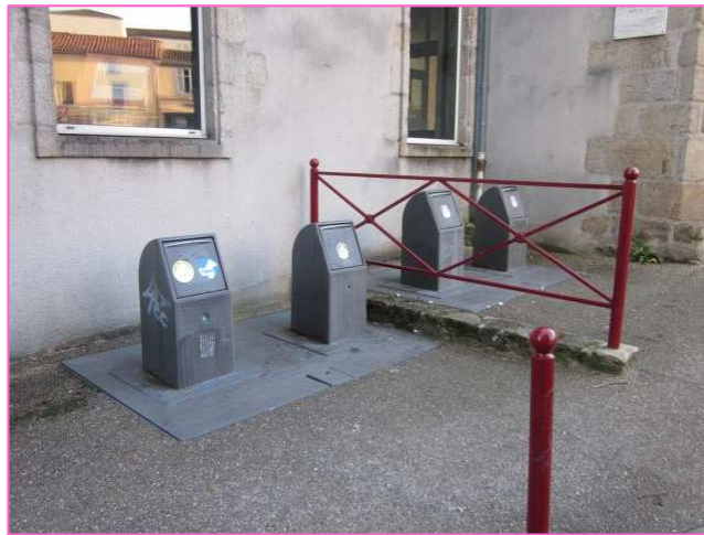
Conteneurs enterrés - BRESSUIRE

Attention , ce type de conteneur nécessite des travaux de terrassement ainsi qu'un véhicule de levage approprié.