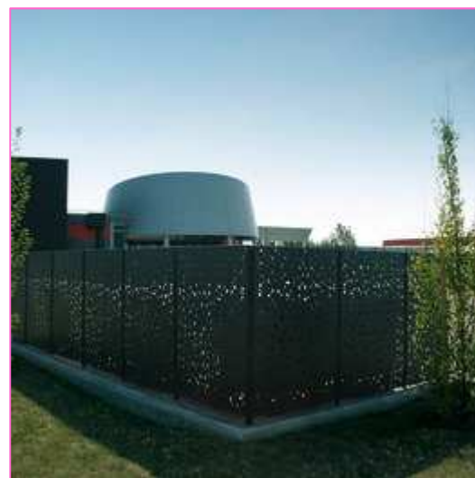
Claustras pour conteneurs

Dans le cadre d'un aménagement d'ensemble, le cache conteneurs peut être assorti au mobilier .